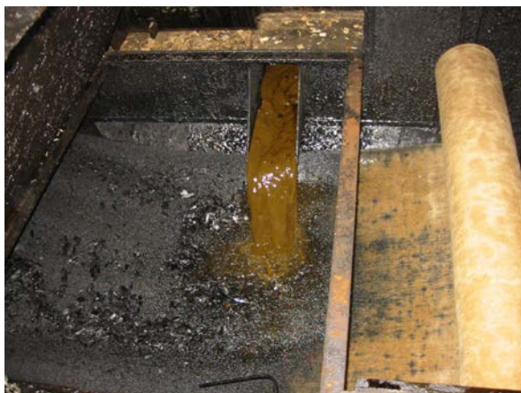
Bandfilter zur Abscheidung fester Stoffe aus dem Waschwasser

Besonders geruchsintensiv sind Kondensate und Waschflüssigkeiten aus der nassen Produktgasaufbereitung. Wer die Anlagen kennt, weiß, wie stark die Geruchsfreisetzungen aus Waschwasser bzw. Kondensat führenden Anlagenteilen sind, wenn diese nicht vollständig gekapselt werden.