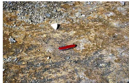
Parallele Striung in der Schliifffläche.