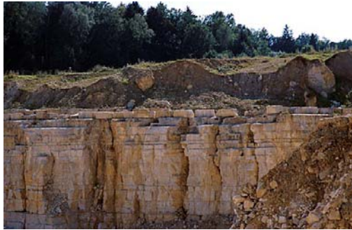
Bruchwand mit Dickbänken des „Treuchtlinger Marmors“. Parallele Striung in der Schliifffläche, darüber die Bunte Breckzie, in der auch große Malmböcke zu erkennen sind.