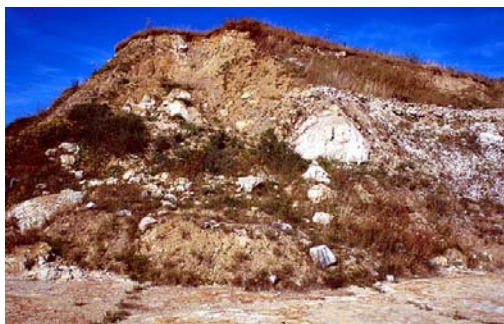
Trümmermassen über der Schliifffläche.