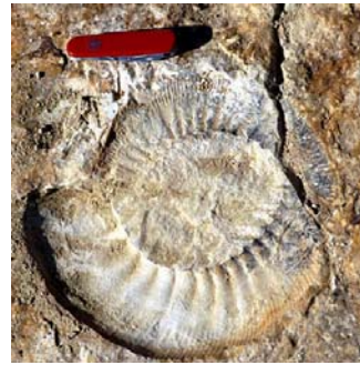
Ammonitenabdruck auf der Schliifffläche.