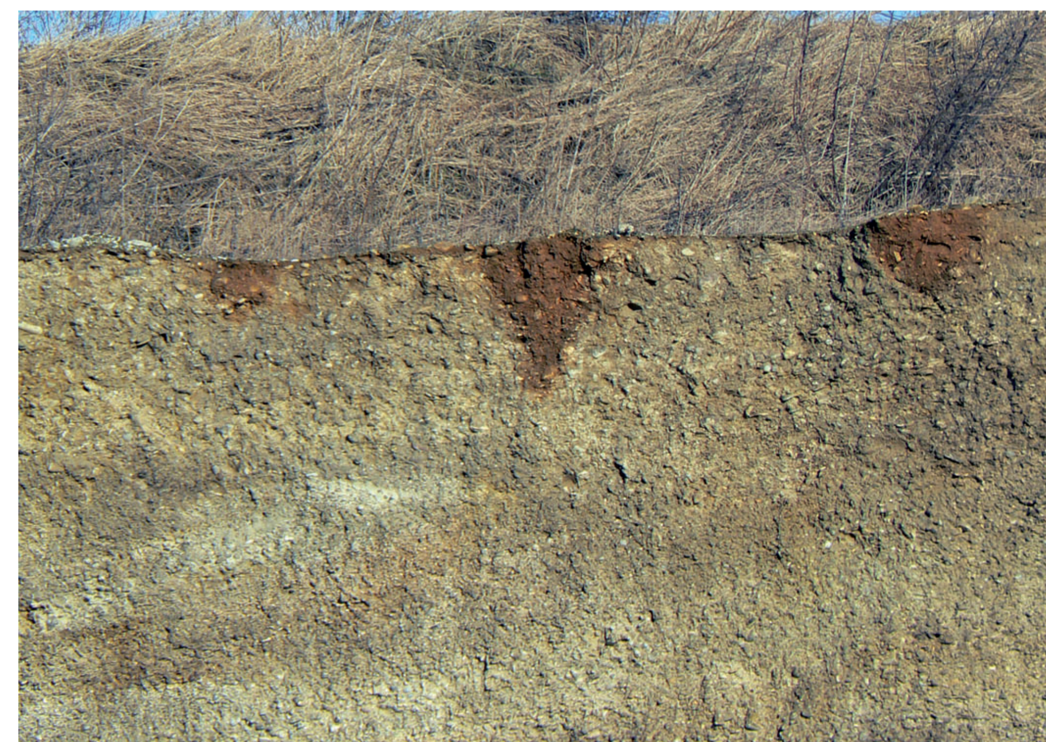
Im Anschnitt einer Kiesgrube erkennt man die beginnende Entstehung von lehmgefüllten Verwitterungstaschen in Hochterrassenschottern der vorletzten („Riß-“) Kaltzeit.

Bei Oberschroffen liegt am Talrand der Alz ein ehemaliger Steinbruch in Schottern des drittletzten Glazials, in Bayern traditionell „Mindel“ genannt. Unter warmen und feuchten Klimabedingungen der Interglazialzeit zwischen dem Mindel- und dem späteren Rißglazial bildeten sich tiefgründige Böden. Die Wurzelatmung der Pflanzen reicherte das Sickerwasser mit Kohlendioxid an, das den Kalk aus den obersten Schotterlagen löste. Tiefer im Untergrund fiel in den Hohlräumen zwischen den Kieselsteinen der gelöste Kalk wieder aus – ähnlich wie Sinter in einer Tropfsteinhöhle. So wurde der ursprünglich lose Schotter zu einem standfesten Konglomerat verbacken.