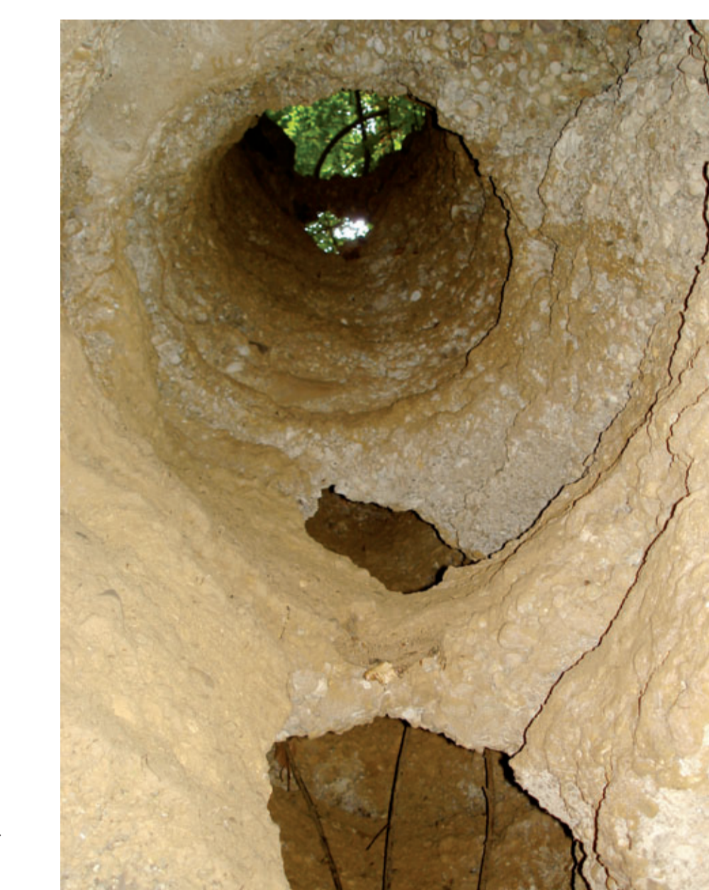
Blick von unten durch eine Geologische Orgel, deren Füllung bereits fehlt.

Durch den Gesteinsabbau wurden bei Oberschroffen derartige Verwitterungsschlote mit einem Durchmesser von etwa einem halben Meter freigelegt. Teilweise sind sie an der Steinbruchwand zur Hälfte angeschnitten und sehen daher wie Orgelpfeifen aus. Andere liegen noch etwas hinter der Wand und sind nur von unten her in kleinen Überhängen erkennbar. Manche Röhren beinhalten noch ihre originale Lehmfüllung, aus anderen ist diese bereits nach unten herausgefallen.