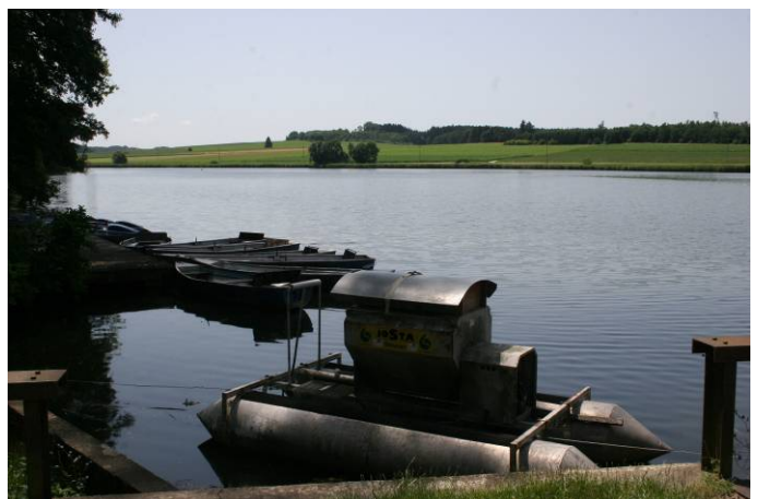
Blick auf den Langweiher mit Bootsverleih