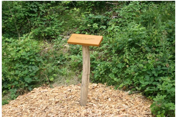
Klapptafel mit einer Quizfrage