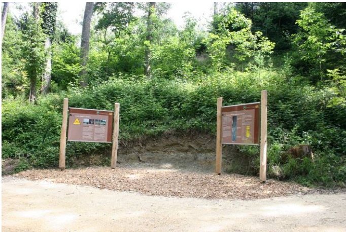
Blick auf die Station 6