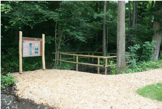
Blick auf die Station 2

Die Umgebung lädt zum Wandern und Verweilen ein.