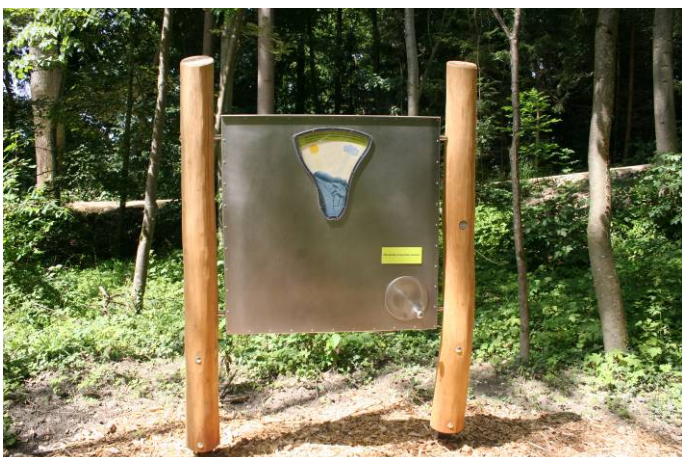
Interaktives Element bei der Station 8 - Bodenentwicklung