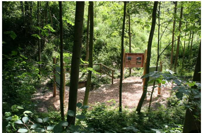
Blick auf die Station 8