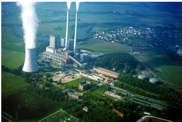
Luftbild des ehemaligen Braunkohlekraftwerks Dachelhofen