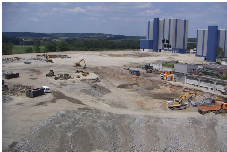
Abschluss der Sanierungsmaßnahmen mit Einbau der güteüberwachten Recyclingbaustoffe