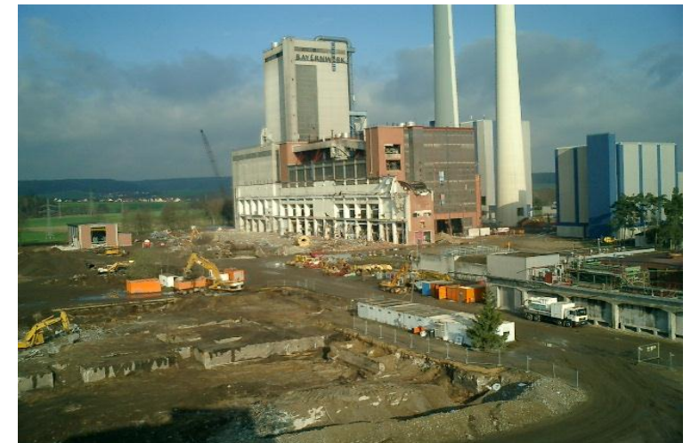
Sanierung des ehemaligen Betriebsgeländes

Aus verfüllten Ascheabsetzbecken wurden etwa 28.000 m 3 Erdstoffe bzw. Aschen mit Stör- und Fremdstoffen (Baumschnitt, Wurzelstöcke) aus baugrundtechnischen Gesichtspunkten im Hinblick auf die Folgenutzung ausgekoffert, von Abfällen befreit und ebenfalls güteüberwacht wiedereingebaut. 3.000 m 3 Aushub mit Verunreinigungen durch Asbest bzw. Mineralwollen oder mit Belastungen durch Metalle (Arsen) und/oder PAK wurden extern entsorgt.