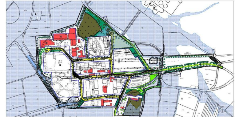
Umstrukturierungsplan des Kraftwerks Schwandorf

Auf dem westlichen Teil des Blockes wird von E.ON Bayern ein Bioheizkraftwerk errichtet. Die nördlichen Teile der ehemaligen Werksiedlung sowie die Aufstandsfläche der ehemaligen Ascheabsetzbecken werden in absehbarer Zeit als Lagerfläche genutzt. Werden die übrigen Flächen bis 2012 nicht durch die E.ON Kraftwerke GmbH veräußert, gehen diese auf Grundlage eines Rahmenvertrags mit der Stadt Schwandorf in deren Besitz über. Somit ist bereits mit dem nahenden Abschluss der Sanierung des alten Industriestandorts und der Folgeentwicklung zu einem Gewerbestandort ein wesentlicher Teil des ehemaligen Betriebsgeländes einer neuen Nutzung zugeführt.