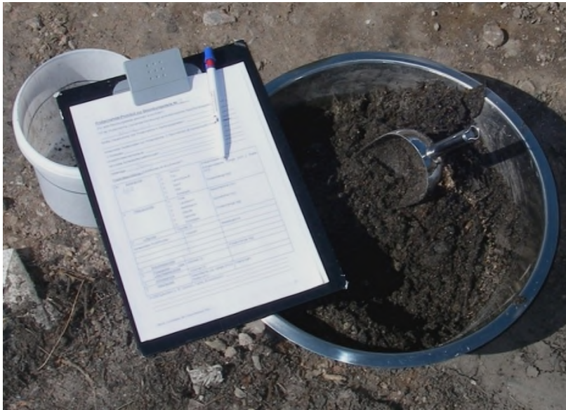
Abb. 1: Probe und Probenahmeprotokoll