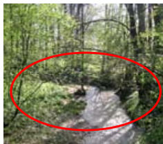
▲ Bach, naturnah: Querprofil ist flach und strukturreich. Hochwasser ufer frühzeitig in den Auwald aus => Idealer Rückhalt.