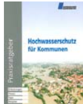
▲ Hochwasser: Wie aus kommunaler Sicht damit umgehen?