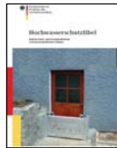
▲ Individuelle Bauvorsorge: Wichtig um Schäden erst gar nicht entstehen zu lassen.