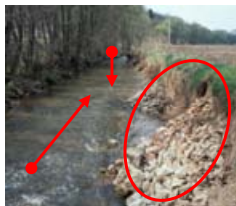
▲ Bach, ausgebaut: Sohle eingetieft, Ufer erodiert, Nutzung bis ans Ufer => Hier hilft eine Gewässeraufweitung mit Sohlanhebung.