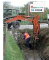
▲ Ständig wiederkehrende Sohlraumung vor einem Durchlass. Eine Brücke würde hier die Situation dauerhaft verbessern.

Unterhaltung in der Ortslage bedeutet insbesondere, das Abflussvermögen des Gewässers zu sichern.