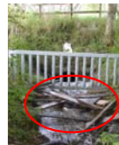
▲ Geschwemmselrechen vor einem Durchlass schützt vor Verklauung