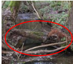
▲ Bach, naturnah: Das Totholz bremst das Hochwasser und fördert den Rückhalt in der Fläche => Ideal wenn unterstrom keine Verklauungsgefahr besteht.

Zielgerichtete Unterhaltung in freier Landschaft fördert den Rückhalt in der Fläche.