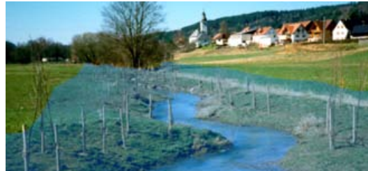
▲ Fotomontage vorher, nachher: Die Entscheidung liegt bei uns, ob wir das Wasser möglichst schnell an die Unterlieger weiterleiten oder ob wir dort, wo es möglich ist, den Rückhalt in der Fläche, z.B. mittels einer Gewässerrenaturierung, fördern.

Naturnahe Land- und Forstbewirtschaftung, nachhaltiger Umgang mit Regenwasser aus bebauten Bereichen, vorausschauende Gewässerunterhaltung, Eigenentwicklung der Gewässer, Gewässerrenaturierung, ... Alle haben eines gemeinsam: Hochwasser wird dort gebremst wo es entsteht.