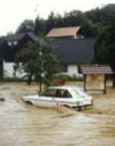
▲ Kleines Gewässer (Einzugsgebiet ca. 17 km 2 ) Das Hochwasser kommt schnell und ohne ausreichende Vorwarnzeit.

Hochwasser ist ein Naturereignis, das nicht vermeidbar ist. Die durch Hochwasser verursachten Schäden können aber gemindert werden.