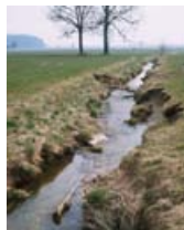
▲ Gemeinsam Lösungen finden: Wo sollen und können sich Bäche entwickeln, wo müssen Sohle und Ufer stabilisiert werden?

Die Gewässer-Nachbarschaften bringen Theorie und Praxis vor Ort zusammen.