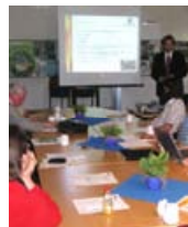
▲ Nachbarschaftstag: Theorie am Vormittag

Gewässer-Nachbarschaften leben vom Gespräch. Deshalb gibt es die Nachbarschaftstage als Plattform für den Austausch von Erfahrungen und Wissen.