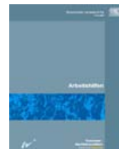
▲ Unterlagen im Internet: www.lfu.bayern.de oder www.gn-bayern.de

Das Bayer. Landesamt für Umwelt bietet im Internet und zum Bestellen zahlreiche Unterlagen an.