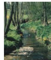
▲ Bäche mit Gehölzsäumen prägen und bereichern unsere Kulturlandschaft und sind die Heimat zahlreicher Pflanzen und Tiere.

Kleinere Flüsse, Bäche und Gräben prägen das Bild unserer Heimat entscheidend mit.