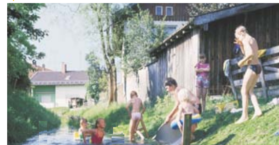
▼ Lebensqualität: Ein sauberer Dorfbach, der zum Baden einlädt.

In Bayern sind die Kommunen zuständig für die Unterhaltung von zirka 90.000 Kilometer kleinerer Fließgewässer. Dies gewässerökologisch und wirtschaftlich durchzuführen erfordert einiges an Wissen und Erfahrung. Know-how, das fast immer vor Ort vorhanden ist – verteilt allerdings auf verschiedene Experten und Institutionen. Es geht darum, dieses Wissen zusammenzuführen. Dort, wo es darauf ankommt: in der unmittelbaren Nachbarschaft.