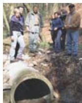
▲ Gemeinsam Lösungen finden: Wo können Verrohrungen entfernt werden?