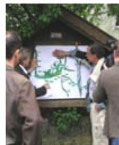
▲ Ein Gewässerentwicklungs-konzept wird vorgestellt.

Wissenstransfer und Erfahrungsaustausch leben von kompetenten Fachleuten.