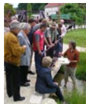
▲ Nachbarschaftstag: Praxis am Nachmittag