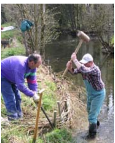
▲ Entwickeln: Flechtzaun als Leitbühne zur Strukturverbesserung einbringen.