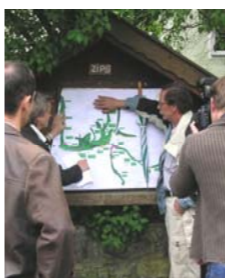
▲ Vorstellung und Diskussion eines Gewässerentwicklungskonzeptes