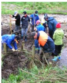
▲ Ein Gewässerabschnitt wird in einer Aktion mit Schulklassen auf Grundlage eines Gewässerentwicklungskonzeptes naturnah entwickelt. Lernen und Spaß vor Ort!

Gewässerentwicklungskonzepte für kleinere Gewässer werden von qualifizierten Planungsbüros im Auftrag der Gemeinden und Verbände erstellt.