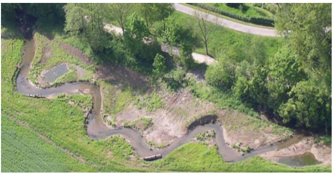
Gestalten: ▼ Großflächige Gewässerrenaturierung durchführen

Das Gewässerentwicklungskonzept sollte mit dem notwendigen Wissen, Zeit und Fläche schrittweise und flexibel umgesetzt werden.