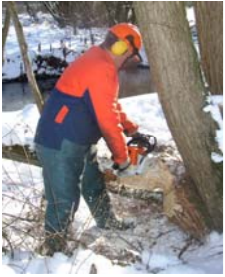
▲ Pflegen: Gehölze abschnittsweise auf den Stock setzen.