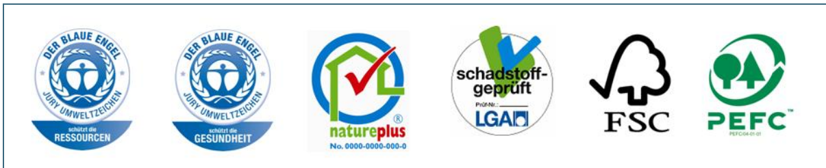
Abb. 1: Die wichtigsten Gütesiegel – Der Blaue Engel, natureplus, LGA-schadstoffgeprüft, FSC und PEFC.