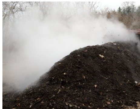
Abb. 3: In Kläranlagen werden Kohlenhydrate, Fette und Eiweiße abgebaut. Ausgefaulter Klärschlamm kann mehr oder weniger stark riechen.

Abb. 2: Guter Kompost riecht erdig. Für die Rotte braucht er Sauerstoff.