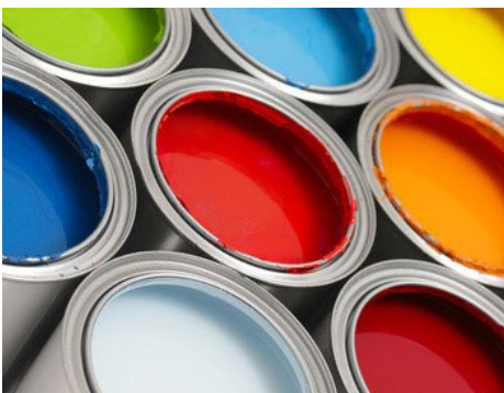
Abb. 7: Wer sein Zuhause mit neuer Farbe oder einem neuen Boden aufpeppt, sollte lösemittelfreie Farben und Kleber verwenden: Schon wegen der Gerüche und aus gesundheitlichen Gründen sind sie empfehlenswert. Darüber hinaus tragen die Lösungsmittel bei sehr sonnigem und warmem Wetter zu hohen Ozonwerten bei.

Bundesverband Verbraucherinitiative e.V. ↓ www.label-online.de