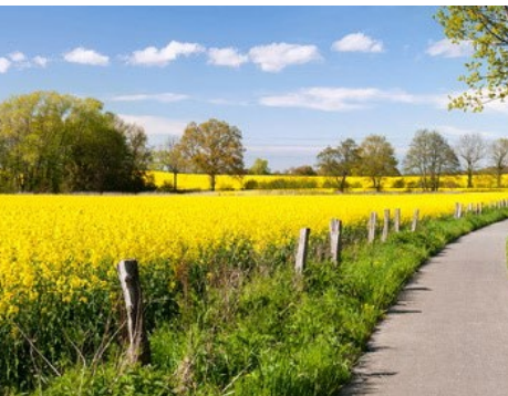
von links nach rechts

Gerüche entstehen meist durch Stoffgemische , wobei die Bestandteile oft sehr zahlreich und häufig nicht eindeutig chemisch-analytisch identifizierbar sind. Außerdem können sich die Komponenten überlagern oder gegenseitig beeinflussen, so dass die Geruchswirkung aufgehoben oder verstärkt wird. Manche Geruchsstoffe verändern sich mit der Zeit, wenn sie mit Luft oder Licht in Kontakt kommen. Damit kann sich auch die Geruchswirkung eines Stoffgemisches ändern.