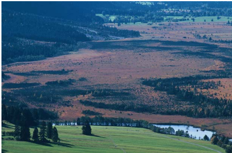
Pfrühlmoos, im Vordergrund Mühlbach, Bild: A. Mayer

Hervorzuheben ist vor allem das wegen seines Erhaltungszustandes herausragende Pfrühlmoos mit einmaligen, dem weit berühmteren Murnauer Moos ebenbürtigen Vegetationszonierungen. Beginnend beim Randlagg auf der Estergebirgsseite mit Bruchwäldern und Seggenriedern, über Zwischenmoor- und Hochmoorausbildungen, mit und ohne Latsche/ Spirke, bis zu den Loisachbegleitenden Auwäldern, in diesem Abschnitt mit Schwarzerle, sind grob die Vegetationseinheiten zu nennen, die das Pfrühlmoos prägen. Eine detaillierte Würdigung der Pflanzengesellschaften ist in diversen Gebietsbearbeitungen nachzuschlagen BRAUN (1995), MELZER (1996) .