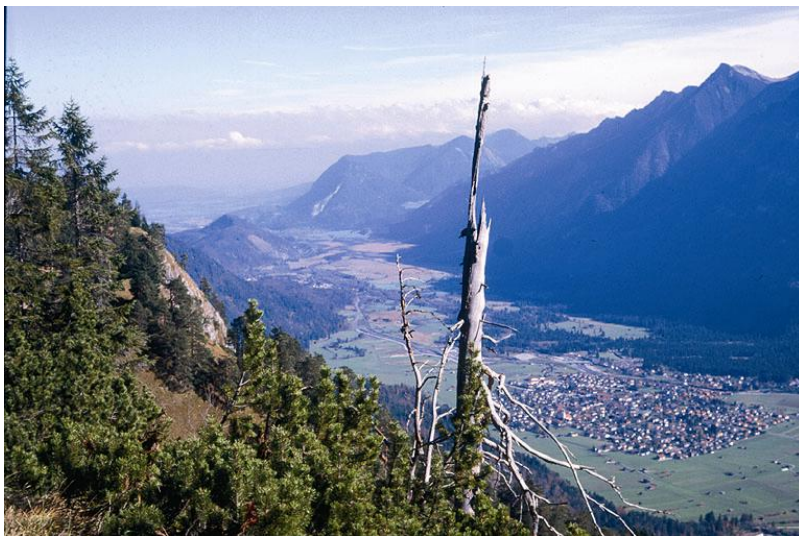
Loisachtal vom Kramer aus, Blick auf Farchant, im Hintergrund Auerberg und Pfrühlmoos

Das Niederwerdenfelser Land wird im Südteil durch den Großnaturraum Kalkhochalpen, d.h. das Karwendelgebirge mit dem Isartal und dem Wettersteingebirge mit dem Wandfuß der Wettersteinwand (dort höchster Punkt des Naturraumes bei 1600 m), dem Kreuzeck und dem Eibsee-Bergsturzgebiet, begrenzt. Die Hanganstiege des breiten Talraumes von Garmisch-Partenkirchen und des Richtung Eschenlohe zur Alpen-Flachlandgrenze ziehenden Loisachtales begrenzen den Naturraum zum Ammergebirge und zum Estergebirge (Kocheler Berge).