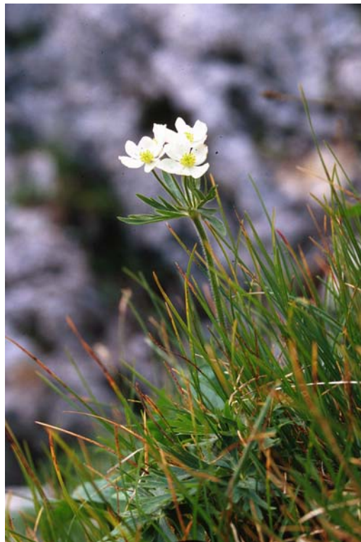
Anemone narcissiflora (Narzissenblütige Anemone) in einer Buckelflur bei Klais