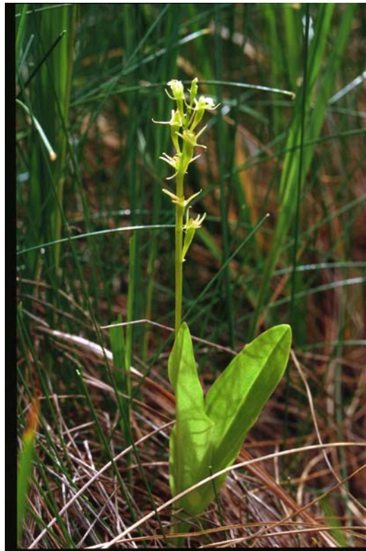
Liparis loeselii (Glanzstendel) im Pfrühlmoos