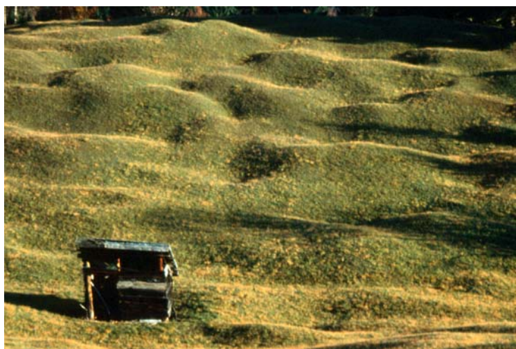
Buckelwiesen bei Klais

Die Kalkmagerrasen des Naturraumes bilden, schon von ihrer Ausdehnung (467 ha von der ABK erfasst), das Zentrum in den Bayer. Alpen. Die Rasen zeigen eine spezielle Artenausstattung, die erstmals von LUTZ und PAUL, 1947 als Silberdistel-Horstseggenrasen ( Carlino-Caricetum sempervirentis ) beschrieben wurde. In ihrem Grundgerüst beinhalten die Magerrasen die typische Artenausstattung der Tieflagen-Trespenrasen, die durch zahlreiche alpine Sippen ergänzt wird. Weitere Autoren GUTSER (1997), ENGELSCHALK (1971), RÖSLER(1997) beschreiben das Hauptgebiet, die Mittenwalder Buckelwiesen und die Gesellschaften im Detail, so dass sich eine nähere Beschreibung erübrigt. Neben der speziellen Gesellschaftsbildung ist auch das Erscheinungsbild der meisten Standorte, es sind spätglazial entstandenen Buckelfluren, alpenweit einmalig. Aus der Fülle der beispielhaften Flächen, die teilweise mustergültig per Handmäh bewirtschaftet werden, sind folgende Lokalitäten zu nennen: Kochelberg, Elmau, Umgebung Klais, Ferchenseegebiet, Tonihofgebiet zwischen Klais und Mittenwald.