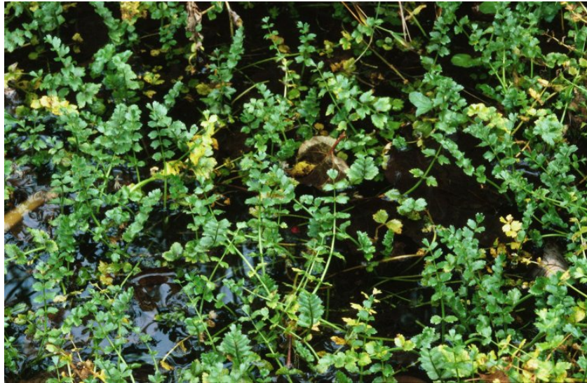
Apium repens (Kriechender Scheiberich), Bild: A. Mayer

Potentilla supina (Niedriges Fingerkraut), wärmeliebende Stromtalpflanze (Bidention-Art), an feuchten, schlammigen Ufern und zeitweise überschwemmten Senken, eine der am weitesten (altweltlich) verbreiteten Arten der Gattung, Verbreitungskarte GERSTBERGER in HEGI 2003, starker Rückgang der Vorkommen bayernweit in den letzten Jahrzehnten, Hauptvorkommen in Bayern entlang von Main und Donau, Nebenvorkommen im Rosenheimer Becken, das kalkärmere Substrat der Innalluvionen sagt der Sippe hier offensichtlich zu, einziges Vorkommen im Bereich der Bayerischen Alpen am Flachufer von Baggerseen in der Kirnstener Au und östlich von Laar am Rand einer künstlich geschaffenen Innaufweitung mit Flachwasserzonen, einzige Nachweise aus den Bayerischen Alpen.