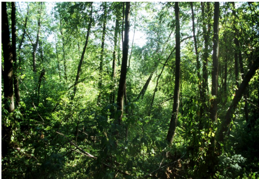
Grauerlenaue am Inn

Vom Wildflusscharakter des Inn, als der beherrschenden Achse im Naturraum, ist nichts mehr übrig geblieben. Zwei Staustufen (Nussdorf, Oberaudorf) im Naturraum geben dem Fluss ein kanalartiges Aussehen. Von der ehemals prägenden Flora und Vegetation alpiner Wildflüsse sind nur noch kümmerliche Reste erhalten. So ist der größte Teil des ehemals nahezu durchgängigen Auenbandes verschwunden. Die Auwälder in ihrer typischen, alpenbürtigen Grauerlenausbildung sind nur noch fragmentarisch vorhanden und durch die Inndeiche und die eng entlang des Flusses geführte Inntal-Autobahn bis auf wenige Reste völlig von der Hochwasserdynamik abgeschnürt. Sie erfahren bestenfalls noch stark schwankende Grundwasserstände durch Druckwasser. Dies verzögert die natürliche Sukzession weg vom Auwald und hin zum Adoxo-Aceretum bzw. zu Fagion-Gesellschaften oder bei dauerhaftem oberflächennahem Grundwasserzug zum Pruno-Fraxinetum, kann sie aber auf Dauer durch die fehlende Flussdynamik nicht verhindern.