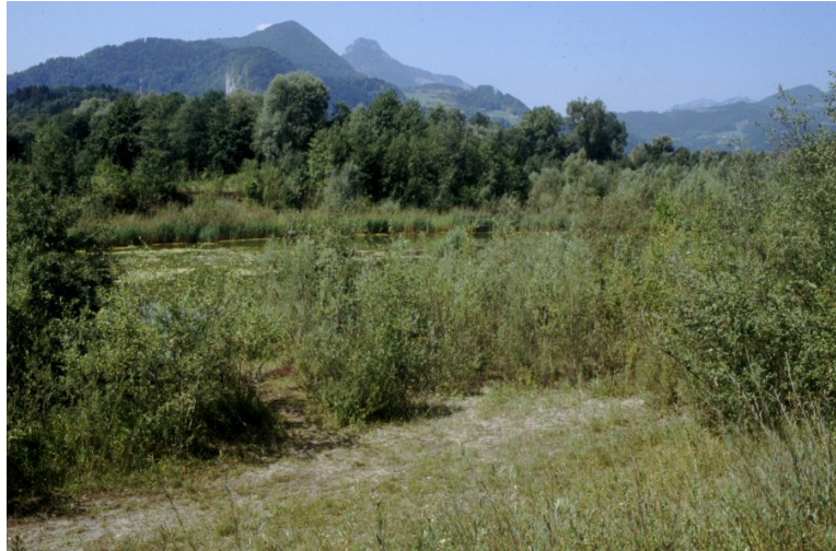
Initialer Weidenauwald unterhalb der Staustufe Oberaudorf, Bild: S. Hofmann

Auch die Flächenanteile des Biotoptyps Sumpfwald werden mit 19 ha von keinem anderen Alpennaturraum im Landkreis erreicht. Die Sumpfwälder sind meist als Traubenkirschen-Eschenwald ( Pruno-Fraxinetum ) mit dauerhaft vernässtem, wasserzünftigem Oberboden ausgebildet.