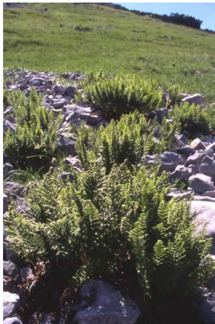
Plattenkalk-Grobschutthalde mit der Gesellschaft des Starren Wurmfarns ( Valeriano-Dryopteridetum villarii ) am Risskopf

Typische alpine Schuttgesellschaften , wie die Täschelkrautflur ( Thlaspietum rotundifolii ) fehlen in den Kocheler Bergen aufgrund der zu geringen Massenerhebungen. Eine in den übrigen Bayerischen Alpen eher seltene Schuttgesellschaft ist im Estergebirge relativ häufig anzutreffen. Es handelt sich um die Gesellschaft des Starren Wurmfarns ( Valeriano-Dryopteridetum villarii ). Die Gesellschaft bevorzugt Grobschutt mit längerer Schneebedeckung in subalpiner Lage und entwickelt sich optimal am Fuß von kurzen Lawinenbahnen. Durch die Grobblocksituation herrschen lokalklimatische Bedingungen (Kaltluftstau durch Klüfte), die denen feuchter, schattiger Felspalten ähneln. Daher sind auch Kleinfarne wie Asplenium viride (Grüner Streifenfarn) und Cystopteris fragilis (Zerbrechlicher Blasenfarn) neben der einzigen Kennart Dryopteris villarii (Starrer Wurmfarn) häufige Begleiter der seltenen Schuttgesellschaft. Viola biflora (Gelbes Veilchen), Polystichum lonchitis (Lanzen-Schildfarn), Adenostyles glabra (Kahler Alpendost) und Valeriana montana (Berg-Baldrian) vervollständigen die Artengarnitur.