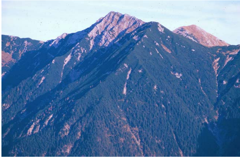
Blick vom Königsstand (Kramer) auf den NW-Abfall des Estergebirges (Risskopf, dahinter Krottenkopf) ins Loisachtal

Alpine Rasen nehmen wie im Ammergebirge den Hauptflächenanteil der Biotoptypen ein, weil große, geschlossene Felsbildungen, wie im Wetterstein oder Karwendel fehlen. Schon wegen der erreichten Höhen konzentrieren sich die Alpinen Rasen dabei auf das Estergebirge. Zerstreute Bestände am Heimgarten sind wegen der fehlenden Höhe deutlich an Kennarten verarmt. Die Süd- und Ostseiten im Estergebirge sind von ausgedehnten Blaugras-Horstseggenhalden ( Seslerio-Caricetum sempervirentis ) bewachsen. Eine auffällige Besonderheit dieser, von Natur aus artenreichen Rasen, ist die teilweise faziesartige Beimengung von Helictotrichon parlatorei (Südalpenhafer) der an diesem Bergstock, zusammen mit Blaugras und Horstsegge, das Grundgerüst dieser Gesellschaft prägt. Auf den Südhängen zwischen Oberem Risskopf und Hoher Kisten sind diese Bestände am typischsten ausgebildet.