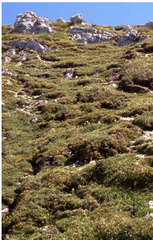
Polsterseggenrasen (Caricetum firmae) am Gipfel des Vorderen Risskopfes

Neben den flächenmäßig vorherrschenden Blaugras-Horstseggenhalden kommen im Estergebirge noch Polsterseggenrasen (Caricetum firmae) und Rostseggenrasen (Caricetum ferrugineae) vor. Der Polsterseggenrasen stellt die am höchsten steigende Rasengesellschaft des Estergebirges dar. Zahlreiche Gipfel und Grate werden von der windharten Gesellschaft steiniger und feinerdearmer Standorte besiedelt. Crepis jacquinii ssp. kernerii (Jacquin's Pippau), Saxifraga caesia (Blaugrüner Steinbrech), Ranunculus alpestris (Alpen-Hahnenfuß), Pinguicula alpina (Alpen-Fettkraut), sowie das Ostalpinelement Rhodothamnus chamaecistus (Zwergalpenrose) gehören neben der allgegenwärtigen Polstersegge zu den wichtigsten Bestandteilen der Bestände. Selten sind Salix serpyllifolia (Quendelblättrige Weide), Gentiana nivalis (Schneeeenzian) und Alchemilla colorata (Gefärbter Frauenmantel) beige-mengt.