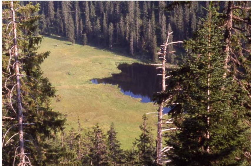
Wildsee mit Verlandungsmooren im Estergebirge

fast 1400 m ungewöhnlichen Schwingdeckenmoore, die den Wert dieser Lokalität bedingen. Neben dem Drahtseggenried ( Caricetum diandrae ) sind es vor allem das Fadenseggenried ( Caricetum lasiocarpae ) und das Schnabelseggenried ( Rhynchosporium albae ), die die Schwingdecken aufbauen. Kleine Latschenfilze komplettieren die Ausstattung. Die Moormächtigkeit ist mit bis zu 4,2 m für die Höhenlage ungewöhnlich hoch, s. SCHUCH & HOHENSTATTER (1976:32).