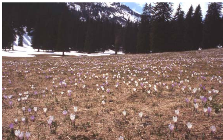
Frühjahrsaspekt der extensiv genutzten Almweiden im Wildseetal (Estergebirge) mit Crocus-Massenvorkommen

Die Almwirtschaft ist im Gebiet auf wenige Bereiche konzentriert, wie am Michelfeld, am Simmetsberg, um die Steppbergalm oder am „Wank“ in der Fortsetzung des Heimgartens.