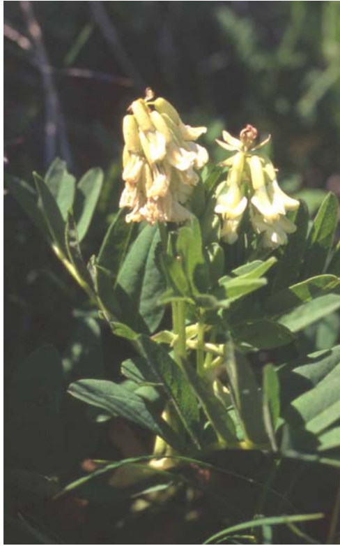
Astragalus frigidus (Gletscherlinse), Bild: R. Urban