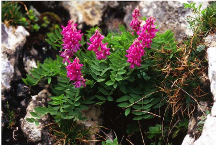
Hedysarum hedysaroides (Alpen-Süßklee)

ssp. alpina (Alpen-Küchenschelle), Oxytropis jacquinii (Jacquins Spitzkiel) und Alchemilla incisa (Eingeschnittenem Frauenmantel). Potentilla crantzii (Zottigem Bergfingerkraut) und Astragalus frigidus (Gletschertraganth) kommen als Raritäten vor.