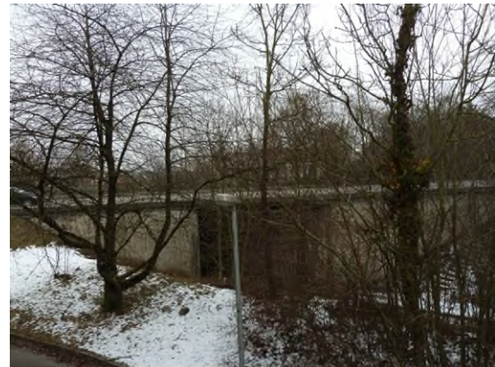
Stationsumgebung Blickrichtung Ost (Aufnahme: Januar 2019)