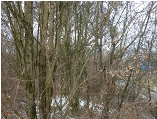
Stationsumgebung Blickrichtung Nord (Aufnahme: Januar 2019)

© Daten: Bayerische Vermessungsverwaltung, EuroGeographics