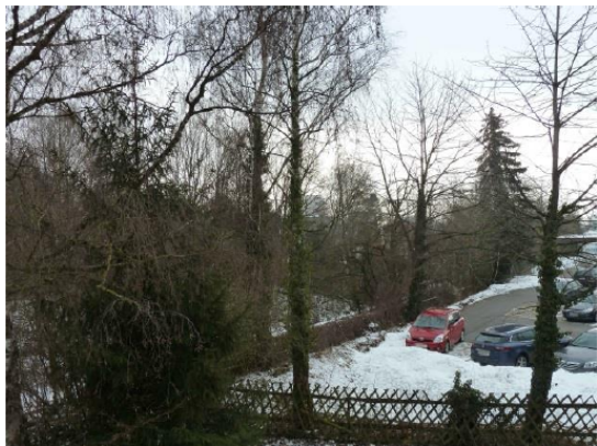
Stationsumgebung Blickrichtung Süd (Aufnahme: Januar 2019)