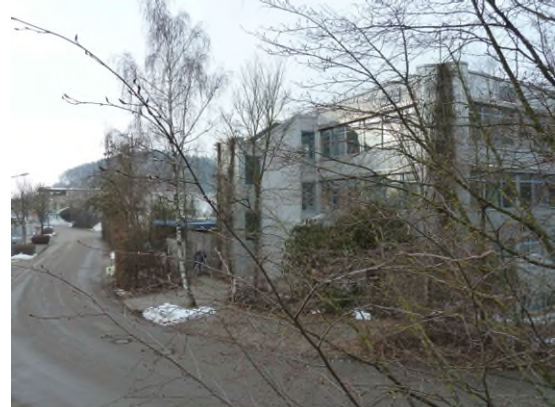
Stationsumgebung Blickrichtung West (Aufnahme: Januar 2019)