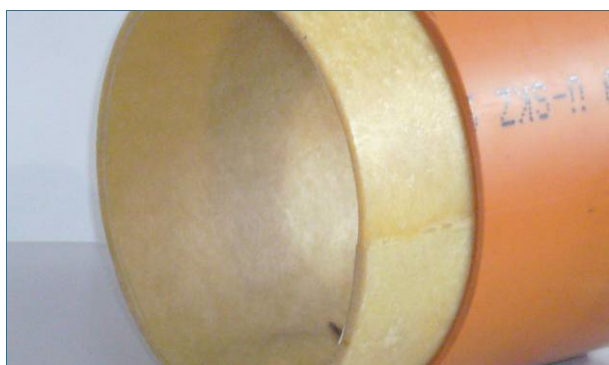
Abb. 5: Egal, ob ein kleiner Schaden mit einem Kurzliner oder die ganze Leitung mit einem Schlauchliner saniert wird, es entsteht immer ein (neues) Rohr im (alten) Rohr.

Beim Schlauchlining wird ein Schlauch aus Glasfasergewebe oder Nadelfilz in die defekte Leitung eingezogen. Der harzgetränkte Schlauch kann über Revisionsschächte, Fallrohre oder den öffentlichen Kanal eingebracht werden. Wenn der Schlauch an der richtigen Position ist, wird er an die Rohrwand gepresst und mit Hilfe von Warmwasser, Dampf oder UV-Licht ausgehärtet.