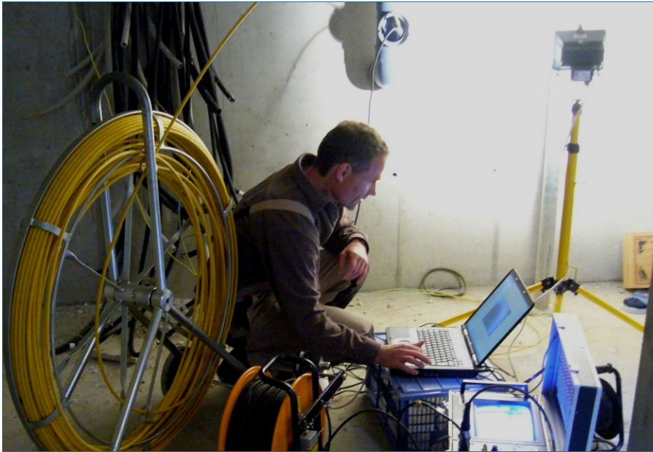
Abb. 2: Ohne Baustelle und Dreck wird bei einer optischen Inspektion die Kamera zum Beispiel über eine Revisionsöffnung im Keller in die Abwasserleitung geschoben.

In der Regel reicht die optische Inspektion aus, auch wenn die Kameras kleinere Schäden in den Rohrverbindungen „übersehen“ können.